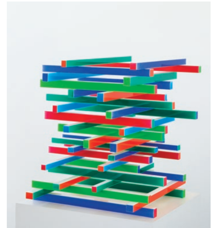
Construction 1. 2014, acrylique et vernis sur bois, 57 x 57 x 54,5 cm.

« Le simple fait », écrit Guillaume Cassegrain dans son livre La Couleur, histoires de la peinture en mouvement , « de "laisser tomber" une matière fluide pourrait incarner le geste primordial d'où naît l'art. » Chez Elissa Marchal, il ne s'agit pas de représentations de coulures mais de sa présentation même en aplats tendus et compacts. Les peintres qui posent la couleur en couches multiples et la poncent tels Al Martin, Kwang Bum Jang ou Christophe Verfaille retrouvent les couches colorées enfouies et représentent le travail du tableau ou du temps par une archéologie colorée. Au contraire, dans la picturalité d'Elissa